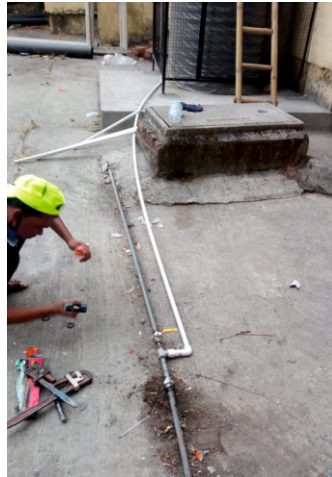
Pipeline from water tank on ground floor to water tank on terrace