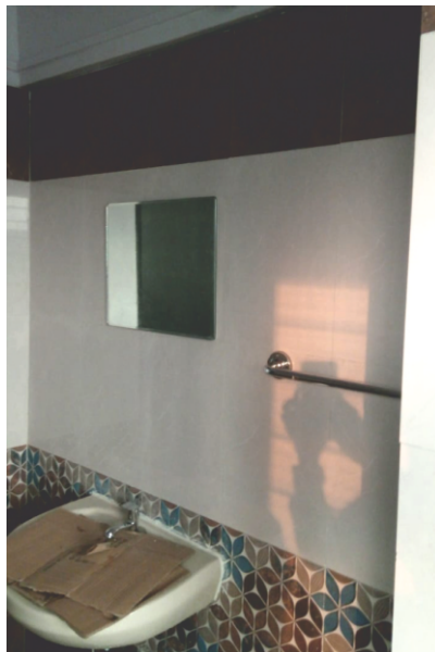
Toilets complete with mirror, WHB and Towel rod

COCHLEA WARTA COCHLEA WARTA COCHLEA WARTA COCHLEA WARTA COCHLEA WARTA COCHLEA WARTA