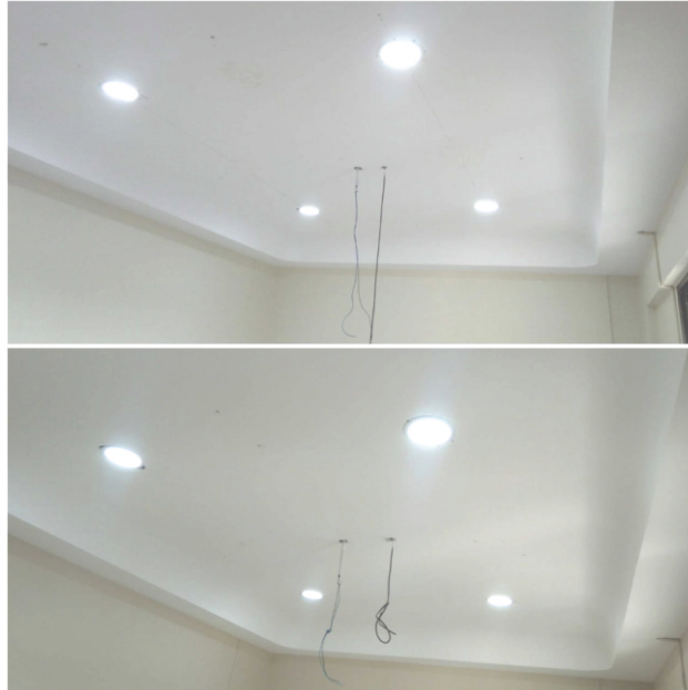
False ceiling in Director's and Principal's room

COCHLEA WARTA COCHLEA WARTA COCHLEA WARTA COCHLEA WARTA COCHLEA WARTA COCHLEA WARTA