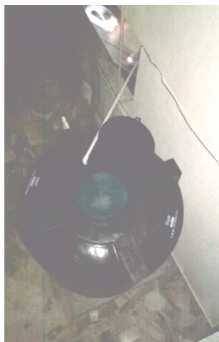
Water tank on terrace getting filled with water from tank on gr fl.